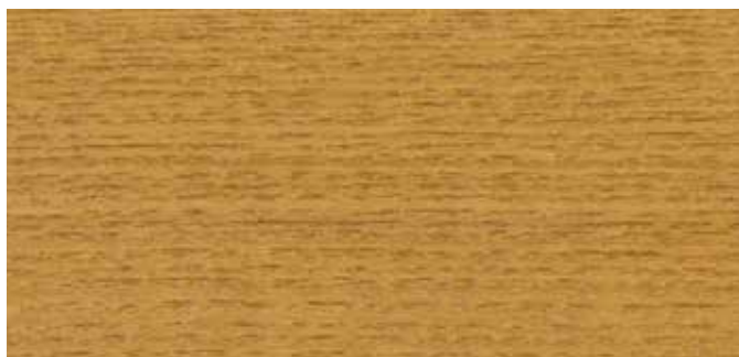
10083 EICHE ANTIK