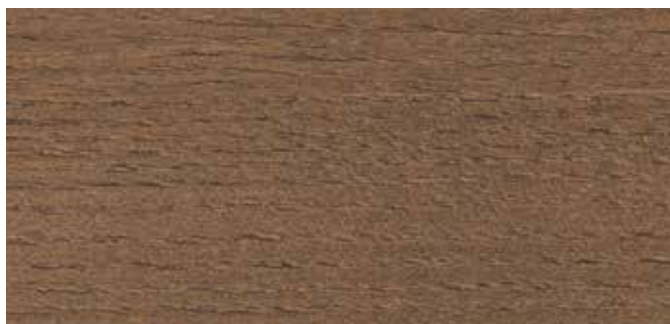
9052 EKSOTISK TRE