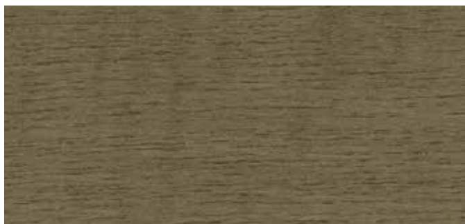
0637 NY STENGRÅ