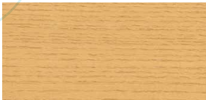
0631 NATURAL WOOD