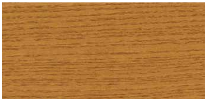
10009 EICHE DUNKEL