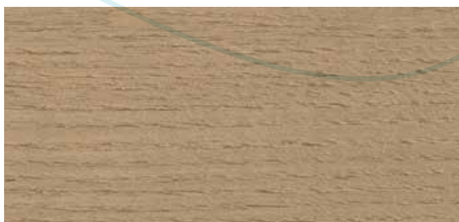
9074 NORDISK TRE